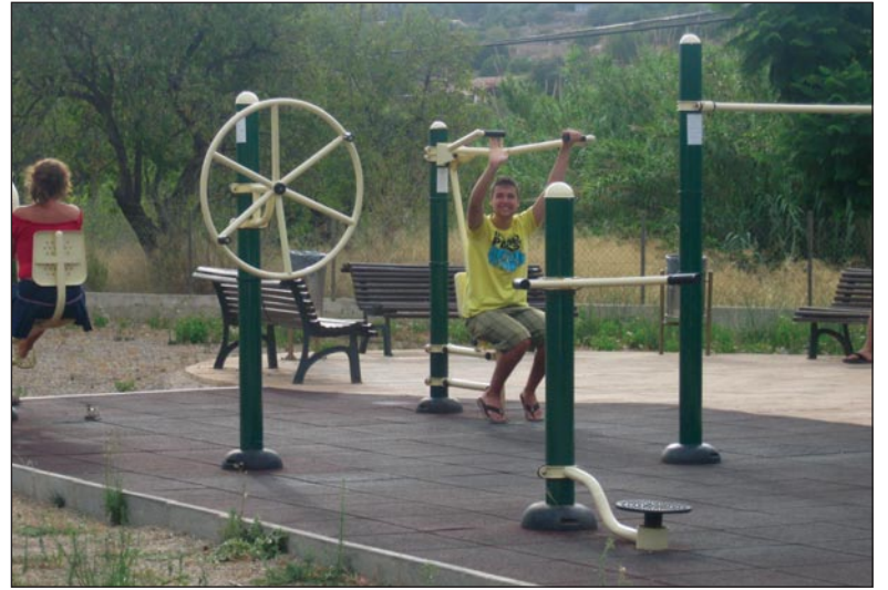
Υπαίθριο Δημοτικό Γυμναστήριο στο Δήμο της Μαγιόρκα (Ισπανία)