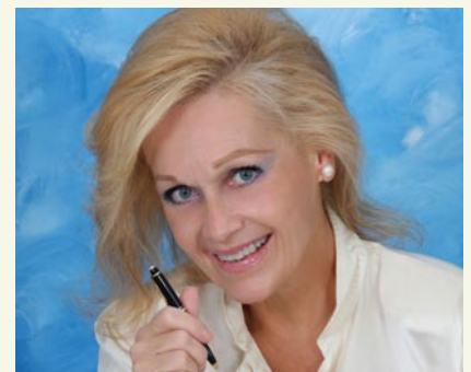
Η Πρόεδρος του Δημοτικού Οργανισμού Πολιτισμού, Αθλητισμού και Περιβάλλοντος (ΔΟΠΑΠ) Dr Ελένη Ευαγγελοπούλου,

Το Festival γιορτάζει φέτος 16 χρόνια λειτουργίας, αναδεικνύοντας το πολιτιστικό γίγνεσθαι του Ενιαίου Δήμου Παπάγου - Χοθαργού. Η συμμετοχή καταξιωμένων καλλιτεχνών, φημισμένων ορχηστρών και θεατρικών σχημάτων, έχει αναδείξει το Festival, που άρχισε το 1995, ως μια από τις πιο ποιοτικές καλλιτεχνικές διοργανώσεις στην Ελλάδα. Το κύριο μέρος του Festival θα λάβει χώρα στο κηποθέατρο της Δημοτικής Κοινότητας Παπάγου, ένα θέατρο σύγχρονων απαιτήσεων, το οποίο φιλοδοξούμε να αποτελέσει σημείο αναφοράς για τα πολιτιστικά δρώμενα της πόλης μας κατά τους θερινούς μήνες. Για το Festival 2011 του Ενιαίου Δήμου αποφασίσθηκε η συμμετοχή τοπικών καλλιτεχνών, παράλληλα προς τις κύριες εκδηλώσεις στο κηποθέατρο. Στο άθροισμα Κεραμικού και Περικλήδους, στην πλατεία του Δημαρχείου και στο χώρο του άθροισμα στο κηποθέατρο, τα εργαστήρια του Πνευματικού Κέντρου θα προβάθουν τις δημιουργίες τους, Τσέκωφ και Ιονέσκο στις πλατείες, εκδήλωση δρόμου από το τοπικό παράρτημα του Λυκείου Ελληνίδων, διαγωνισμός γκράφιτι σε κάποιο από τα Δημοτικά Σχολεύια, είναι μερικές από τις εναλλακτικές προτάσεις προβολής του Πολιτισμού της πόλης μας.