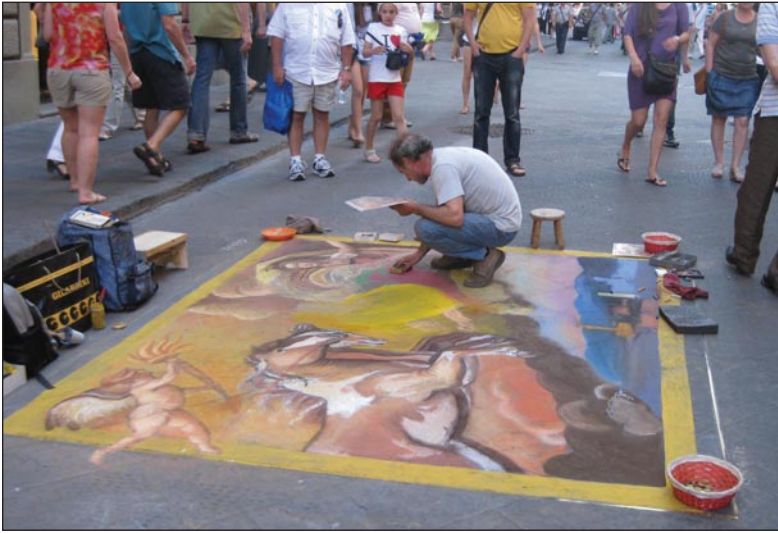
Ζωγράφος δρόμου επί τω έργω στο Δήμο της Φλωρεντίας (Ιταλία)