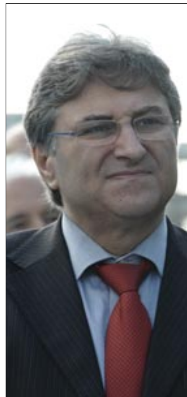
Ο Αντιδήμ. Οικονομικών Ι. Νικηφόρος